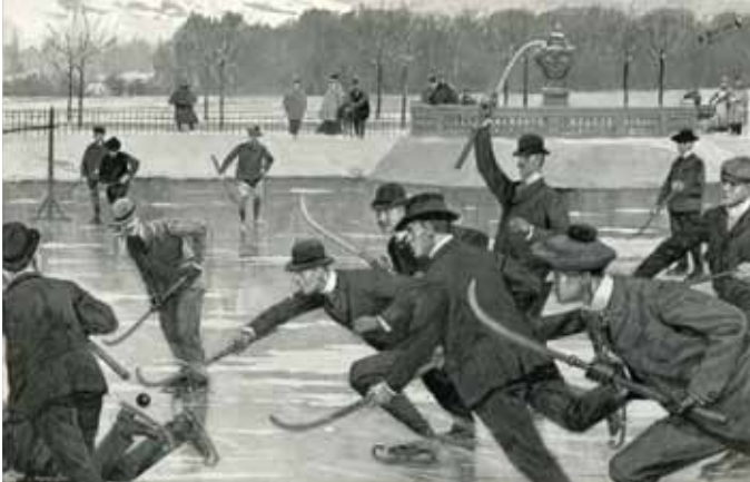
Ballspiel auf dem Eis (im Albertpark zu Leipzig). Nach dem Leben gezeichnet von O. Gerlach

Zahlreiche Gebäude und Plätze im Stadtgebiet Leipzigs sind eng mit regionaler, nationaler und internationaler Sportgeschichte verbunden. An diesen Orten entwickelte sich die Identität Leipzigs als Stadt des Sports. In einer »Sporthistorischen Stadtroute« werden 21 Orte mit herausragenden Themen der Bewegungskultur im Stadtraum markiert. Die Ausstellung thematisiert diese wichtigen Stätten mit ihren Bauten, Ereignissen, Sportarten und Personen aus mehr als 200 Jahren Leipziger Sportgeschichte. Darüber hinaus werden Vorläufer dieser Entwicklung visualisiert.