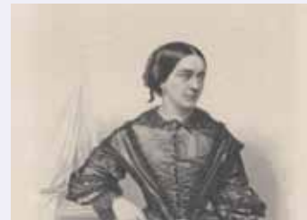
Frauenliebe & Leben Clara Schumann zum 200. Geburtstag 28.8.–17.11.2019 Eröffnung: 27.8.2019