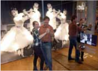
Oh Yeah! Popmusik in Deutschland bis 12.5.2019