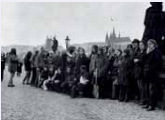
Charta Story Annäherung an die Menschen und die Zeit der Charta 77 11.9.–17.11.2019 Eröffnung: 10.9.2019