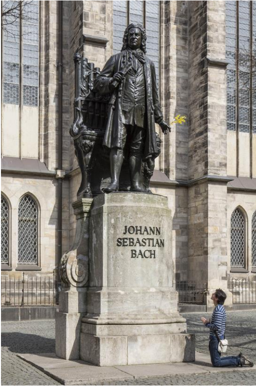
Bachdenkmal (2015), 60 x 42 cm 20 € Peter Franke