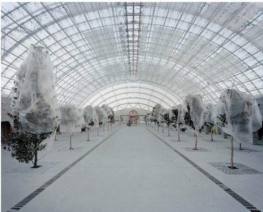
Bauphase der Neuen Messe Leipzig (1995), Bertram Kober