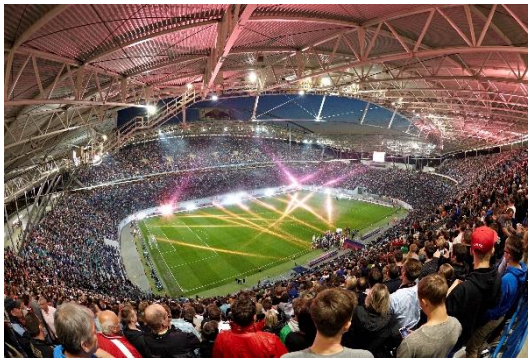
Abschiedsspiel von Michael Ballack, Red Bull Arena Leipzig (2013)