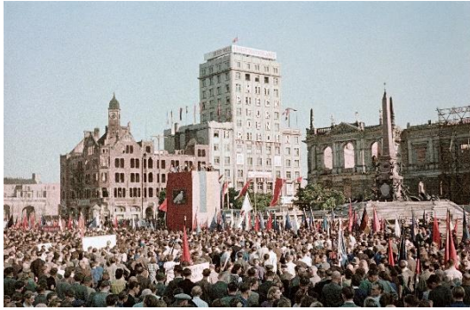
Koreakundgebung auf dem Augustusplatz (1950), Wolfgang G. Schröter