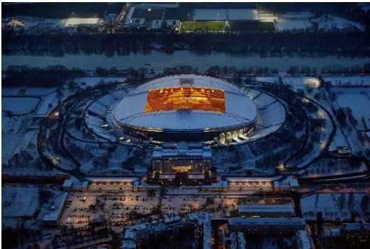
Red Bull Arena (2023), Bertram Kober