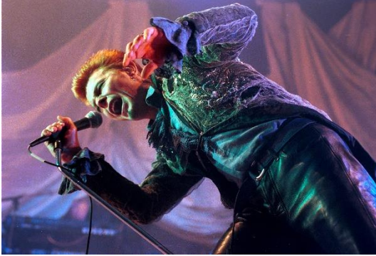
David Bowie, Konzert in Halle (1996)