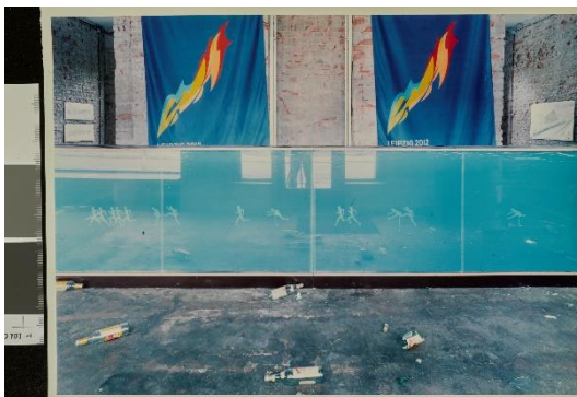
Schaufenster im Ranstädter Steinweg nach der Olympia- Entscheidung (2004), Bertram Kober