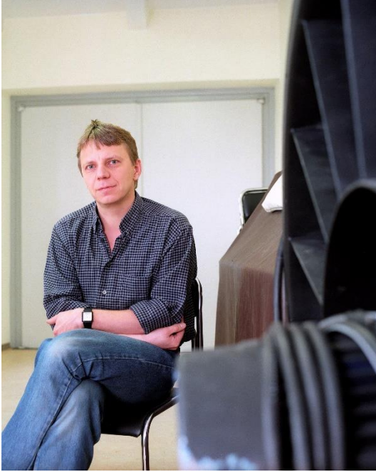
Porträt Andreas Dresen, Regisseur (2001), Stefan Hoyer