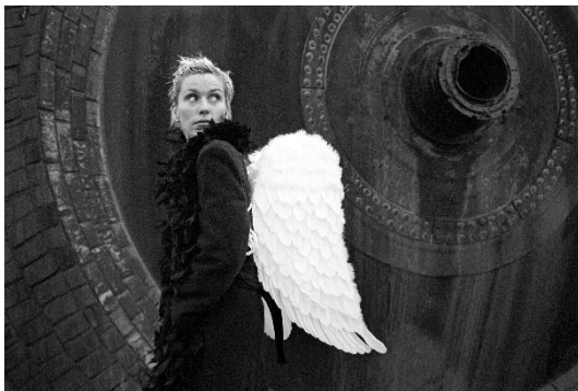
Bea (1998), Stefan Hoyer