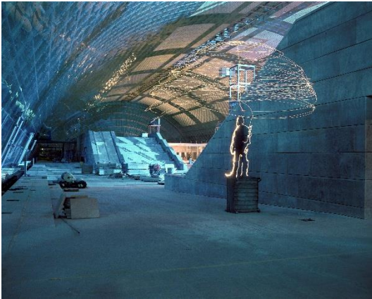
„Lichtthall“, Lichtinszenierung in der Bauphase der Neuen Leipziger Messe (1995), Bertram Kober & Hael Yggs