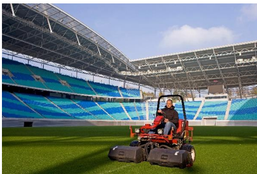
Greenkeeper (2009), Stefan Schmidt