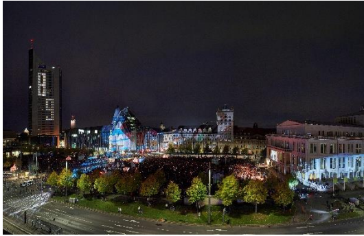
Lichtfest auf dem Augustusplatz (2019), Bertram Kober 231 x 150 cm 100 €