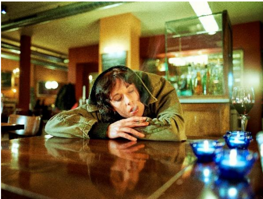
Juli Zeh im „Café Felis“, Karl-Liebnecht-Straße 63, 2007