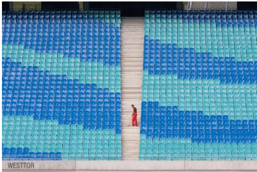
Zentralstadion (2006), Stefan Hoyer