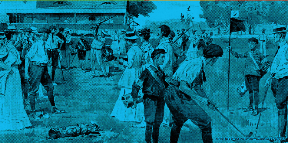
Turnier des Golf-Clubs Gaschwitz 1907. Zeichnung O. Gerlach